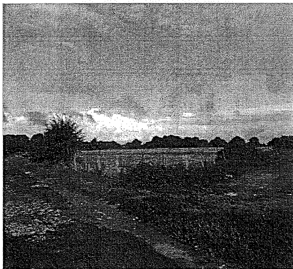
Figure 1 : Extrémité de la haie concernée par l'éolienne 3

Dans le cadre des développements de projets éoliens en Hauts-de-France, un éloignement bout de pale de 200m aux secteurs présentant une forte activité et/ou diversité de chiroptères est préconisé pour éviter tout impact sur les chiroptères (guide de préconisation régional Hauts-de-France paru en septembre 2017, après le dépôt du dossier le 20 décembre 2016). Comme il est relevé dans l'avis de l'Autorité Environnementale, la machine E3 se situe à 115m axe machine non pas d'un linéaire de haie étoffé mais de quelques arbres et arbustes très peu fournis constituant la bordure de la prairie (voir figure 1). Ainsi, l'étude devait déterminer si ce secteur présentait une forte activité et/ou une diversité de chiroptères nécessitant un recul de 200m.